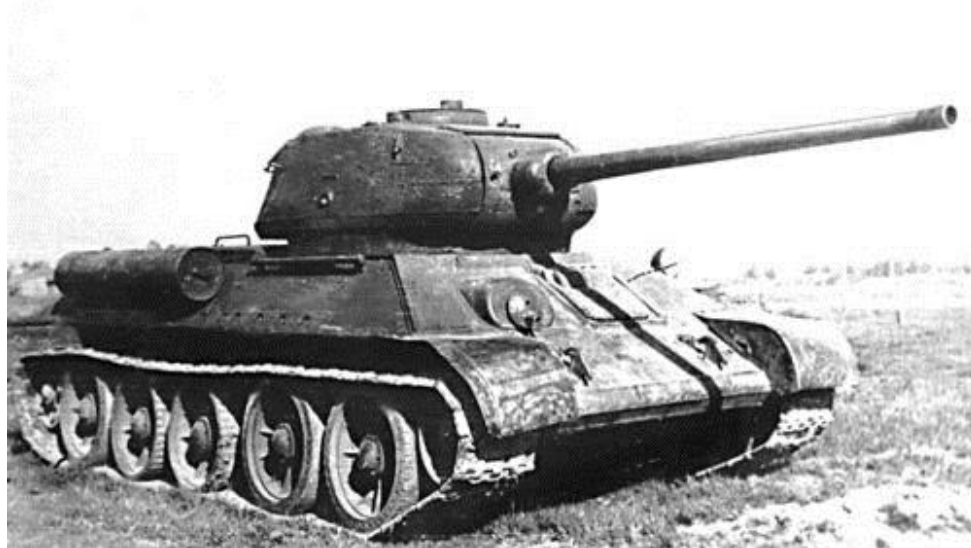
Т-34 (с учетом опыта боевых действий)