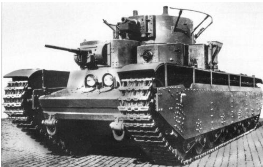
Т-35 (предвоенные годы)